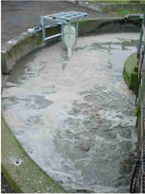
Montage sur voile de bassin