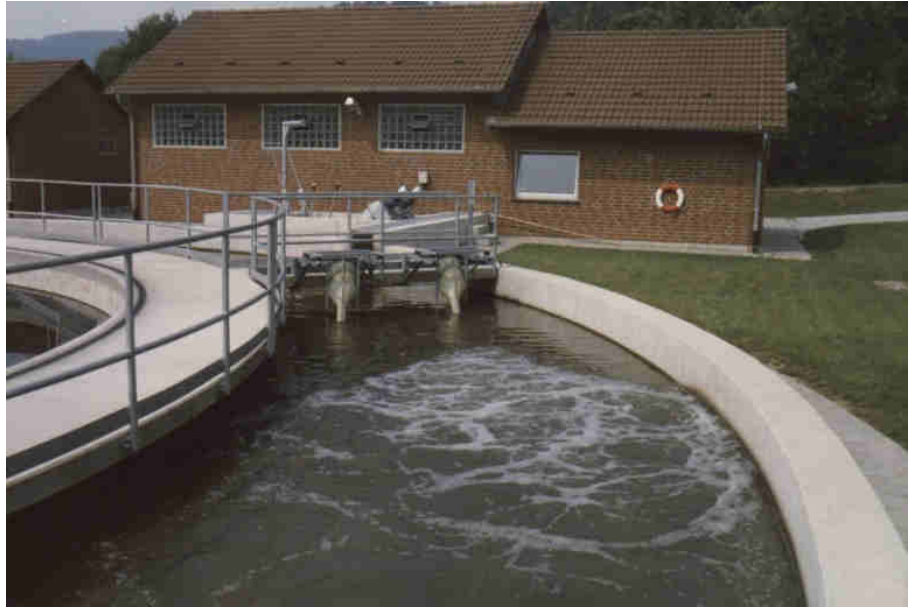
Montage sur passerelle