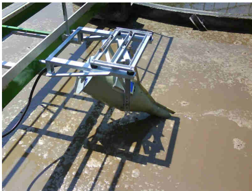
Remplacement de pont brosse

Il n'y a pas de réducteur, le tube tourne en prise directe à 1500 min -1 . Son seul point de liaison avec le moteur est un accouplement conique breveté .