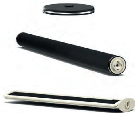
La gamme de produits développés par GVA enrichit le portefeuille de Wilo, notamment en solutions d'aération et d'agitation.

Et parce que l'efficacité et la rentabilité d'une station de pompage dépendent également d'un entretien et d'une