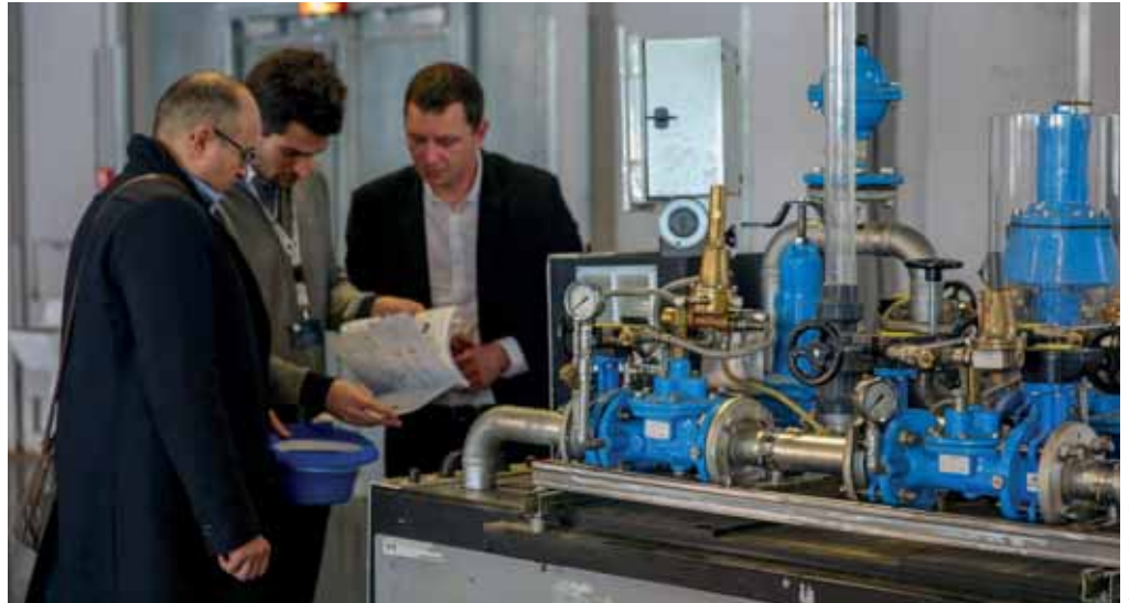
Les visiteurs du village innovation pourront découvrir les dernières solutions qui révolutionnent peu à peu toutes les sphères du domaine de l'eau, qu'il s'agisse d'analyse, de télégestion, de systèmes de pompage intelligents, la détection des fuites, le traitement des eaux usées, des boues, etc...

Les visiteurs de ce village pourront notamment découvrir les dernières solutions mises au point en matière d'IoT, de big data, d'algorithmes intelligents, de modélisation, nanotechnologies... etc qui révolutionnent