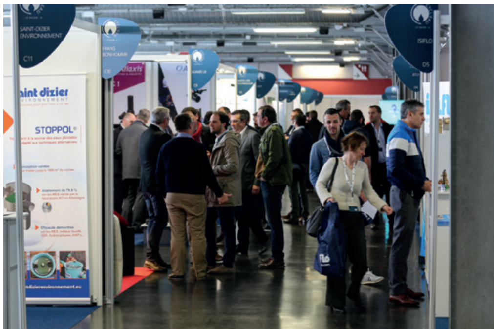
A Vichy, l'événement accueillera une cinquantaine d'exposants sur 2.000 m 2 dans le cadre du Palais du Lac, ouvert sur le lac d'Allier.

Fort du succès obtenu l'an dernier à Bordeaux, CYCL'EAU avait séduit les collectivités du bassin de la Loire qui souhaitent, elles aussi, profiter d'un événement favorisant la rencontre des acteurs de l'eau dans leur région. Un an après, c'est chose faite : collectivités territoriales, élus, compagnies fermières, industriels, bureaux d'études ou encore start-up se rencontreront ainsi dans moins de 2 mois, pour développer leur business et échanger autour de problématiques communes à leur bassin hydrographique.