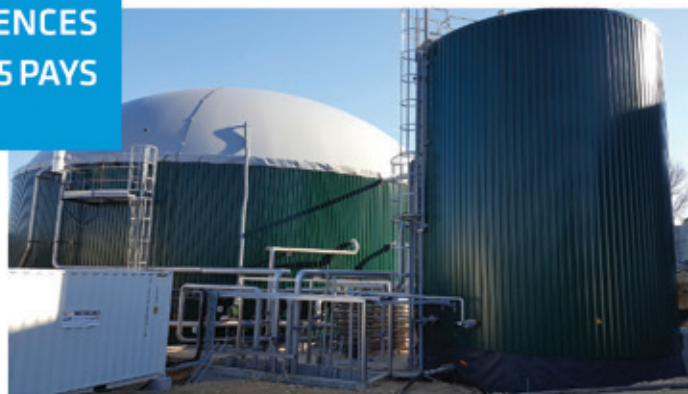
Méthanisation des déchets, France

Technologies complémentaires pour le traitement des déchets organiques et de l'air :