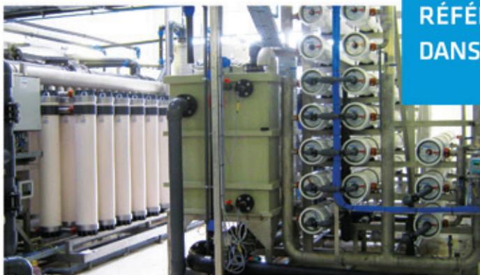
Réutilisation des eaux usées, Belgique