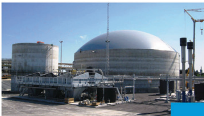
Effluents sucrerie-distillerie, France