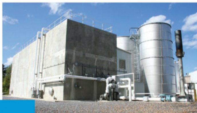
Effluents fromagerie, États Unis