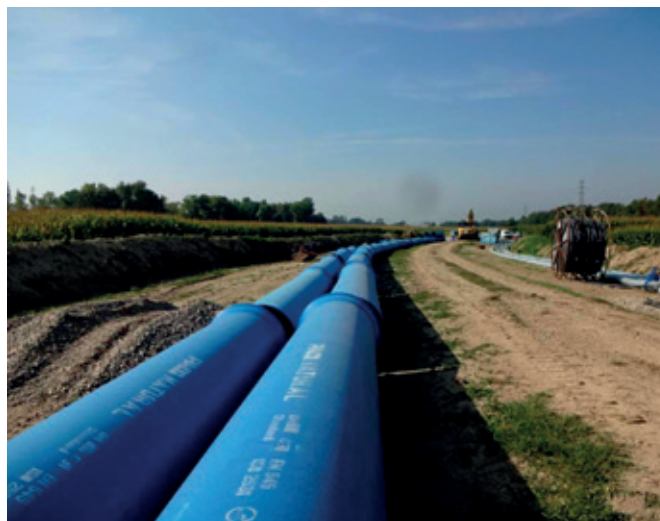
Ce projet, qui constitue l'un des plus importants chantiers de canalisations de France, répond à la nécessité de sécuriser l'approvisionnement en eau potable des 33 communes de l'Eurométropole de Strasbourg et de ses 488.000 habitants.

Le projet consiste en la création d'un nouveau champ captant qui alimentera l'Eurométropole de Strasbourg. Le lieu d'implantation des nouveaux puits se situe au sud de Plobsheim, sur une emprise d'environ 11 hectares, comprenant six puits de forages d'une capacité maximum de 1.000 m 3 /h chacun, un bâtiment d'exploitation abritant les équipements de pompage, de traitement et de stockage de l'eau, et une conduite de vidange dans le contre-canal de drainage. Près de 23 km de conduites permettront de relier le champ captant