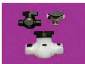
Vanne à boisseau