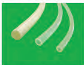
Tube silicone FDA & USP