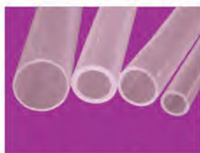
Tube PFA FDA & USP