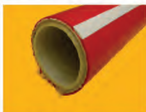
Tube TPE Alimentaire

Cosmétique Biotechnologie Pharmaceutique