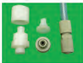
Raccord série 1B

info@em-technique.fr - www.em-technique.fr