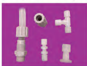
Raccord à bague 1A