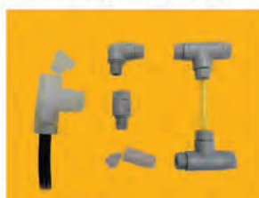
Raccord sans bague 1+