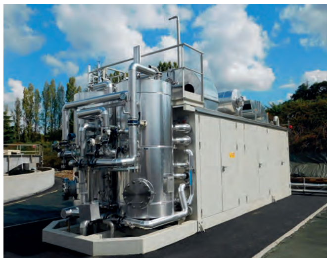
La gamme AE-COMPACT est spécialement adaptée aux sites qui produisent entre 50 et 150 Nm 3 /h de biogaz.

posés indésirables du biogaz afin d'obtenir du biométhane similaire au gaz naturel et donc utilisable pour tous les types d'application du gaz. Pour cela, Arol Energy a développé un produit spécialement adapté aux sites qui produisent entre 50 et 150 Nm 3 /h de biogaz. Ce développement a conduit à la gamme AE-COMPACT qui se caractérise par un produit prêt à être installé sur les sites de production de biogaz.