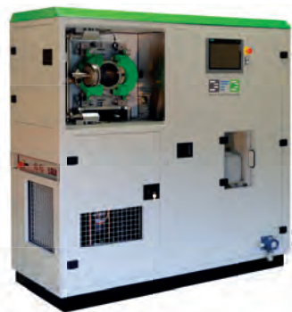
La machine DFD-MC 4.1 dégraisse plusieurs milliers de micro-pièces en polymère de moins de 3 mm de diamètre, en les exposant à une atmosphère de CO 2 dans son domaine supercritique, complétée d'oscillations et d'ultrasons.

et d'ultrasons. À l'issue du cycle de nettoyage, les pièces sortent de l'autoclave propres, sèches et à température ambiante, les particules solides sont évacuées par gravité au fond de l'autoclave et les huiles sont entraînées puis séparées du CO 2 , pour être ensuite récupérées pour réutilisation future. Avantages du procédé: il est 100 % sec et propre, contrairement aux technologies basées sur des solvants chimiques, et consomme moitié moins d'énergie.