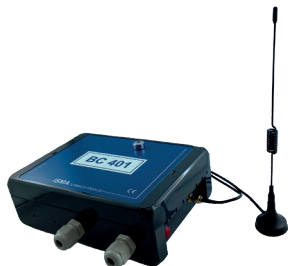
Boîtier communicant BC401

Le BC401 est une passerelle de communication universelle pour centraliser vos données vers un serveur. BC signifie « Boîtier Communicant », il entre dans la communication IOT (internet des objets), il a pour rôle de rendre vos données « connectées ».