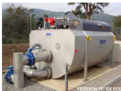
VERSION HORS SOL

Deux unités compactes et autonomes pour des configurations hors sol ou en canal en fonction des contraintes existantes.