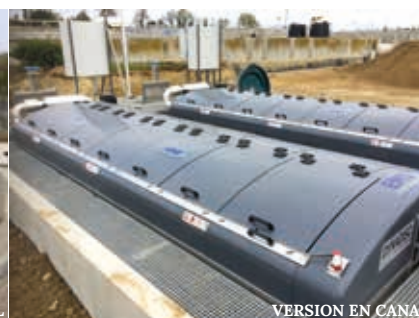
VERSION EN CANAL