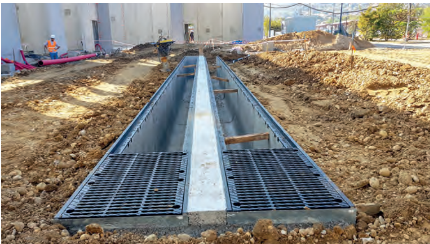
30 m de caniveaux BIRCOmax-i ont été installés sur la zone de retournement du nouveau pôle entrepreneurial de Givors (69).

La création de zones imperméabilisées soulève plusieurs problématiques parmi lesquelles celle liée à la gestion des eaux de ruissellement. À Givors, petite commune du département du Rhône, la construction d'une nouvelle pépinière d'entreprises inclut un projet de zone de retournement pour poids lourds. Beylat TP, la société chargée des travaux d'assainissement de ce point de livraison, a choisi le caniveau BIRCOmax-i pour répondre au mieux aux exigences du projet et aux contraintes du terrain.