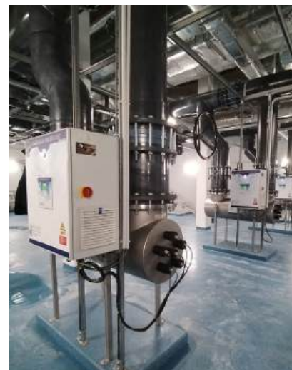
UV Germei a équipé le centre aquatique olympique de Saint-Denis avec des systèmes de déchloramination par UV UVDechlo.

Ces composés, issus de la réaction entre le chlore et les matières apportées par les baigneurs, sont responsables des odeurs et des irritations. « Le chlore que l'on sent dans l'air, ce sont en réalité les chloramines », précise Jérémie Machémy (Xylem France), qui alerte sur leurs effets : elles sont « dangereuses,