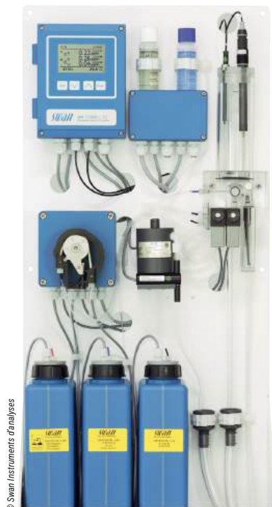
L'analyseur AMI Codes-II CC de Swan Instruments d'analyse mesure en continu le chlore (chlore libre, chlore total et chlore combiné) dans les piscines.

Pour limiter ces effets, des technologies complémentaires se développent. Une réponse opérationnelle existe désormais pour extraire les chlorures et les sous produits issus de la chloration. Le skid de déconcentration des chlorures développé par FGWRS et Gaches Chimie permet de maîtriser durablement les paramètres de la qualité d'eau, tout en réduisant significativement les volumes de renouvellement. Elle constitue ainsi un levier concret d'économie d'eau et d'énergie, affirme FGWRS. C'est aussi le cas des systèmes à ultraviolet (UV), utilisés en complément du chlore. Spécialisé dans ce domaine, Bio-UV Group a développé des équipements capables de détruire les chloramines directement dans l'eau grâce à des lampes UV. « On diminue les irritations oculaires et respiratoires et on améliore la qualité d'air et la qualité d'eau », explique Delphine Cassan. Une évolution qui s'inscrit dans une approche plus globale du traitement. Il faut regarder la piscine dans son ensemble, du bassin au traitement d'air, pour réellement optimiser son fonctionnement. Les systèmes de déchloramination par UV, tels que les UVDechlo commercialisés depuis 2006 par UV Germei, permettent de réduire significativement la concentration en chlore combiné (chloramines)