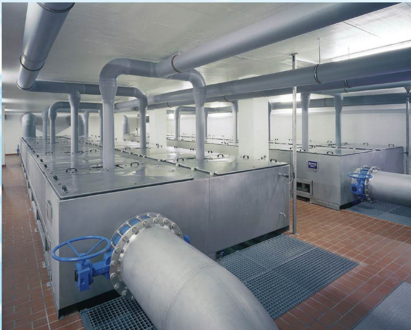
Installation des eaux potables de Bale – débit 1 400 m 3 /h

abaissement du CO 2 libre jusqu'à 2 mg/l ajustement automatique aux variations du débit et qualité d'eau