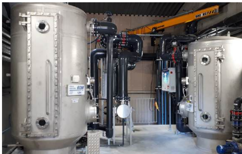
Il s'agit, ici, d'un système de filtre à plateaux de Cifec en conditions réelles d'utilisation dans une piscine publique.

Comme le mentionne l'ARS, « les baigneurs sont à la fois l'origine et la cible des contaminations » 16 , c'est pourquoi il est impératif de bien traiter l'eau. Ainsi, le traitement, dont les équipements sont proposés par des acteurs tels qu'Abiotec UV, Aquacontrol, Bio-UV Group, BWT, Cifec, CIR, Daqua, Eurochlore, Europaz, FGWRS, Gaches Chimie, Gazechim, Grundfos, Hydraco Process, Procath, ProMinent, Syclope Electronique, Tecnofil Industries, TMR, UV Germe, Xylem, etc., repose toujours sur trois piliers : la filtration des matières en suspension (MES), la désinfection et l'apport d'eau neuve. Pour la filtration, première étape du traitement, plusieurs réponses émergent. Des entreprises comme Hydraco Process et Xylem développent des technologies différentes. La deuxième a conçu le filtre Defender, basé sur la perlite (roche volcanique poreuse) qui remplace la diatomée, à cartouche ou les filtres à sable, ainsi que les systèmes de chloration de la marque Wallace & Tierman. « Ce filtre permet une consommation en eau et en énergie plus faible, un gain de place et