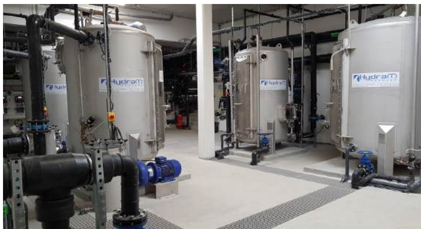
Hydraco Process propose une filtration sur fibres végétales, qui permet de filtrer jusqu'à un micron, comme l'a montré une installation déployée dans un centre aquatique haute-savoyard.

Face au renforcement des exigences d'autosurveillance, de nouvelles technologies permettent désormais aux exploitants de réaliser directement sur site des analyses microbiologiques rapides, sans devoir envoyer les échantillons en laboratoire. « Nos systèmes Alert One et Alert Lab, validés dans le cadre du programme OMS/Unicef "Rapid Water Quality Testing", automatisent la détection des bactéries indicatrices de contamination fécale avec un niveau de précision et de fiabilité comparable à celui des méthodes de laboratoire conventionnelles, et réduit