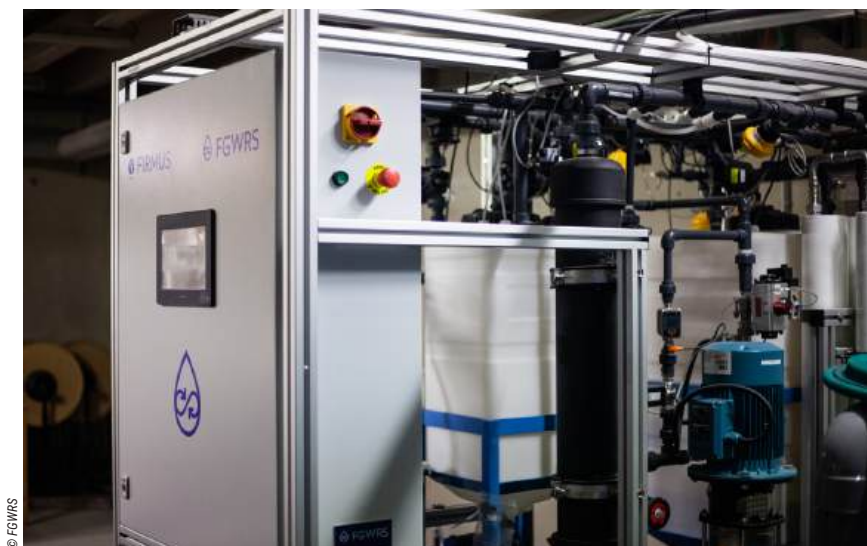
Le skid de déconcentration des chlorures de FGWRs et Gaches Chimie, installé, ici, sur le réseau de traitement d'eau d'une piscine, permet de maîtriser durablement les paramètres de la qualité d'eau, tout en réduisant les volumes de renouvellement.